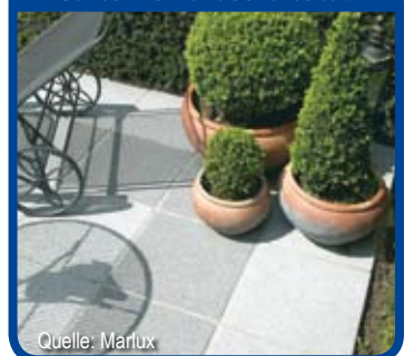
Garten- & Landschaftsbau

Fliesen/Naturstein • Wannen/Duschen Armaturen/Accessoires Sauna/Wellness